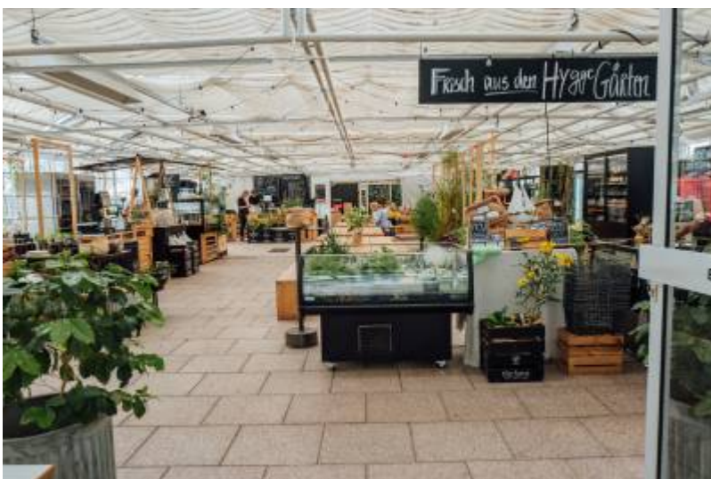
Willkommen in Hygge! https://www.hygge-thefarm.de/

Ähnlich aber etwas anders, gibt es das Konzept bereits in Hamburg: „Hygge the farm“. Der Supermarkt bietet Nahrungsmittel an, die sie in ihrem eigenen Laden anbauen und ernten. Ein Stück Land mitten in Hamburg. Keine Transportkosten und Lieferzeiten. Im Hofcafé gibt es auch Essen aus der eigenen Ernte.