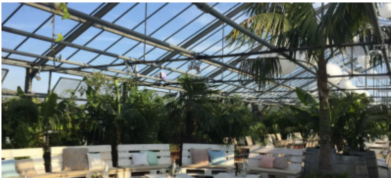
Ein Beispiel wie es aussehen könnte | Fotoquelle:

Mein Gedankenexperiment: 24/7 Gewächshäuser (Urban Gardening) mit Sitzmöglichkeiten, Brettspielen und Obstverarbeitungsgeräten. Die Bürger können jederzeit hingehen und sich gemeinsam um das Wachstum der Pflanzen kümmern. Ihre Ernte können sie mit den Automaten im Gewächshaus zu Getränken verarbeiten oder im Dörrgerät zu gesunden Chips trocknen.